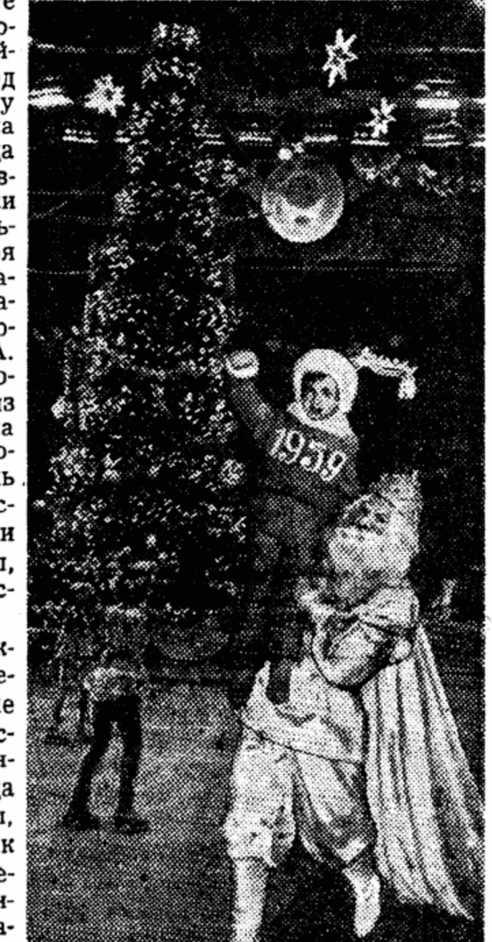
На представлении «Елка дружбы» во Дворце спорта Центрального стадиона имени В. И. Ленина.